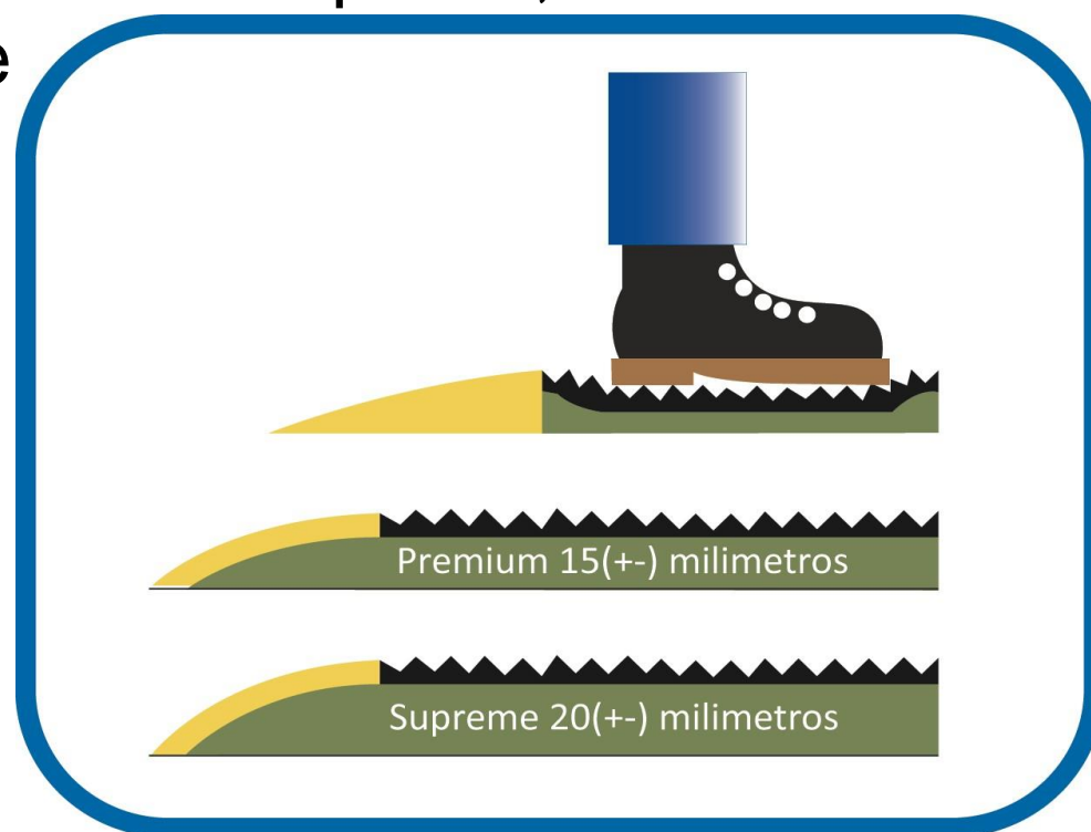
Dos tipos de grosor